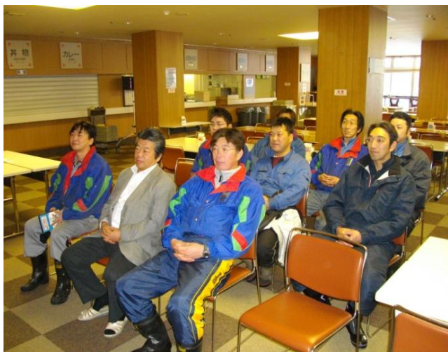
スキーシーズン前のDVDによる講習会