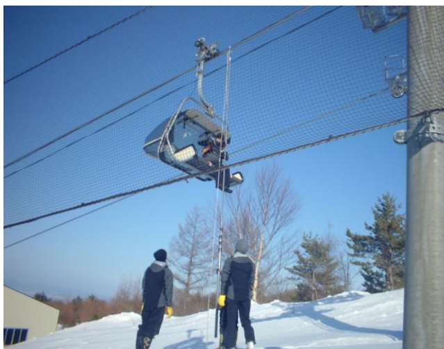
冬期社員等による救助訓練