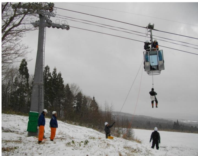
シーズン前の警察、消防署との合同救助訓練