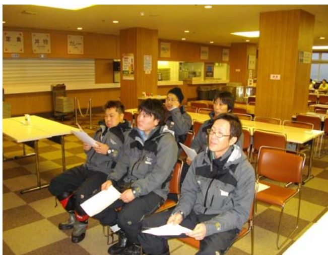
スキーシーズン前のDVDによる講習会