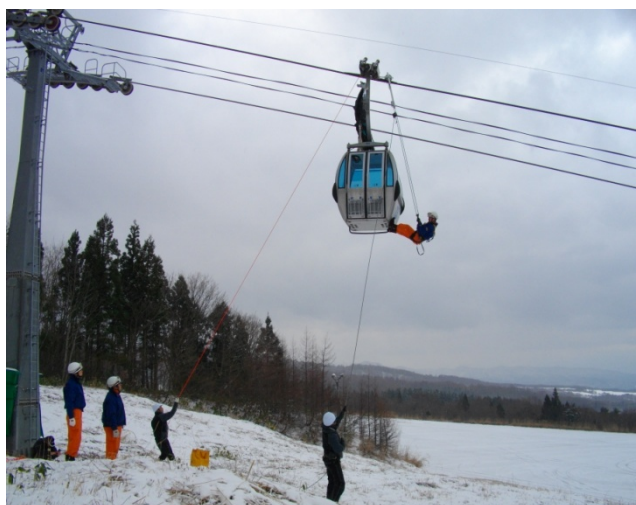
シーズン前の警察、消防署との合同救助訓練