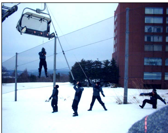
冬期社員等による救助訓練